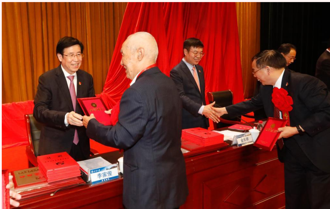
与会领导为获得天津市教育系统、天津大学“两优一先”称号的先进集体、优秀个人颁奖。