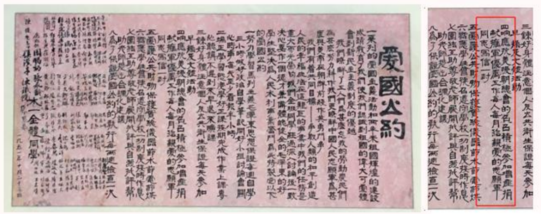
1951 年通过的全校爱国公约

“为抗美援朝捐献飞机、大炮”的签名活动和示威游行也如火如荼的开始了！之后在全校掀起了报名参加中国人民志愿军的运动，师生员工报名踊跃，仅土木系四年级学生报名的就有 28 人，占该系四年级学生的 80%，莘莘学子，满腔热血！