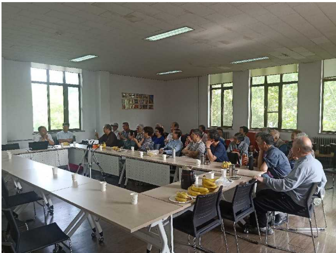
1965 级化工院校友班级聚会