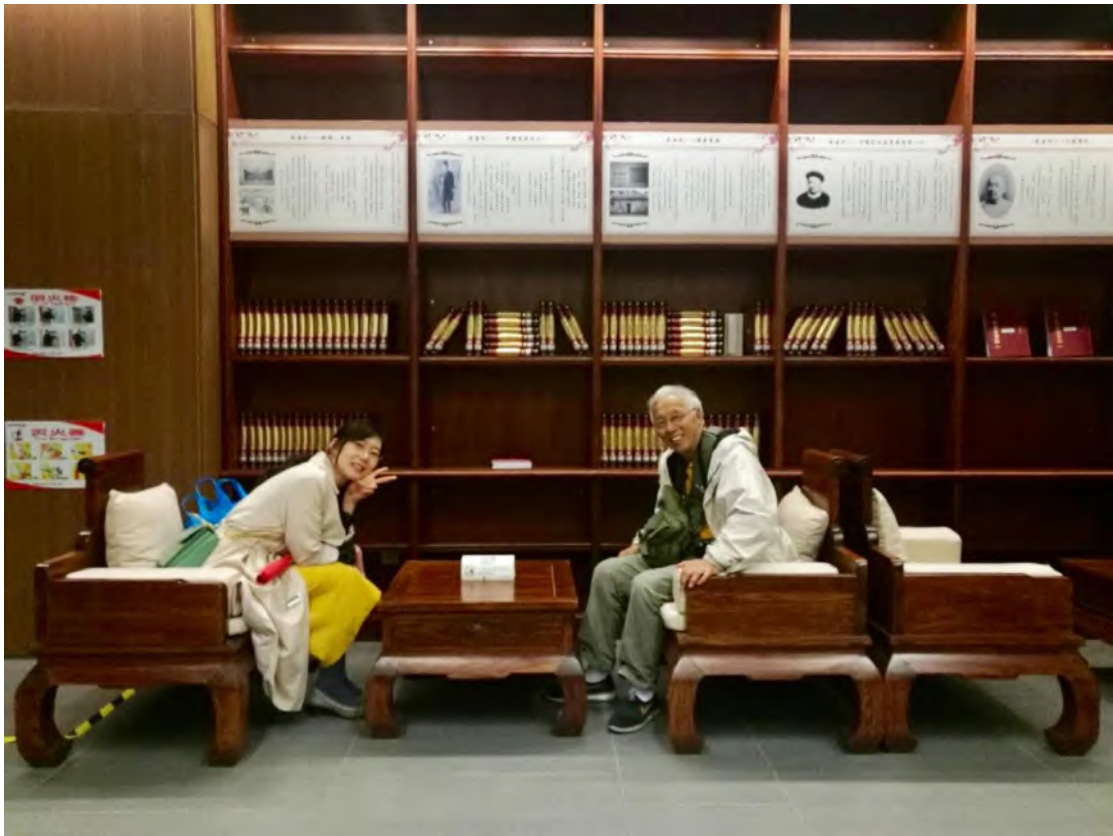
1956 级精仪学院海外校友回母校参观新校区图书馆