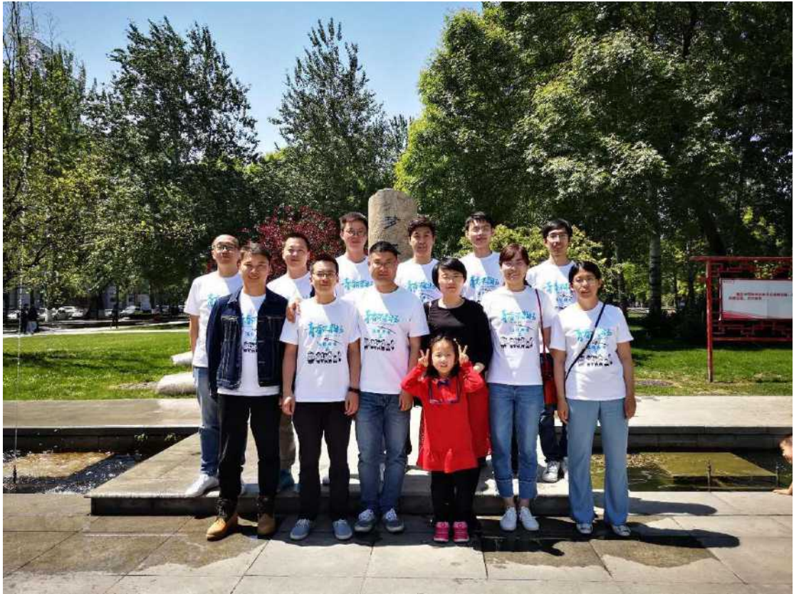
电信学院 2005 级通信工程 2 班校友