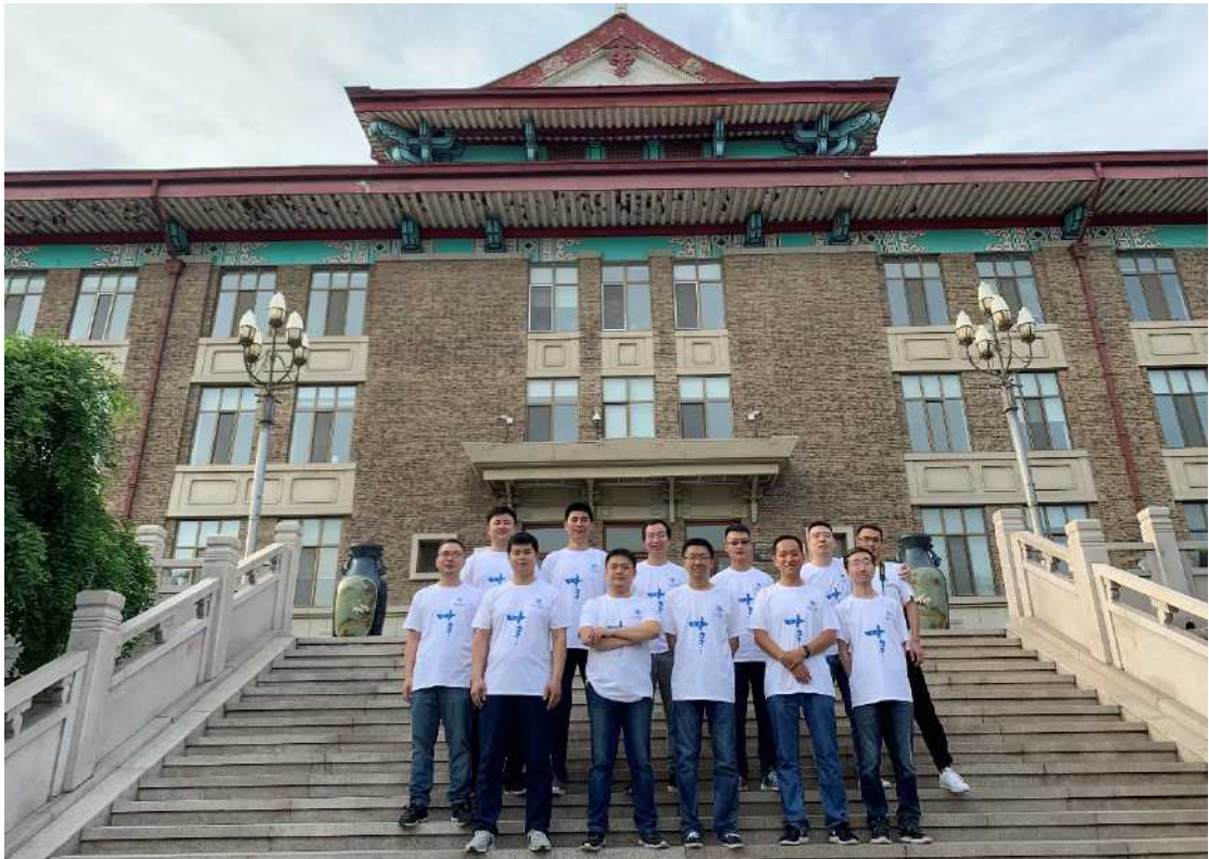
软件工程专业 2005 级 3 班校友