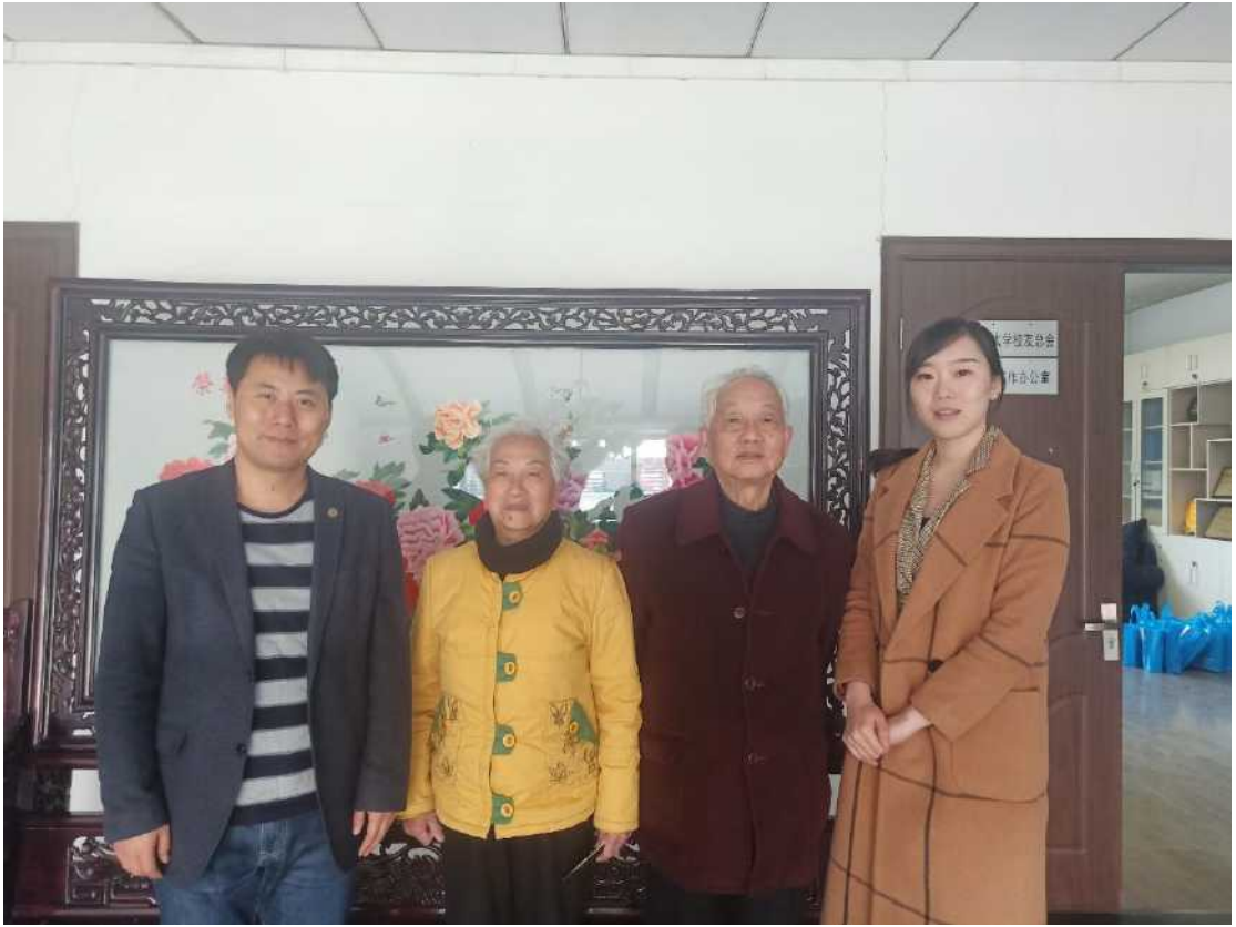
校友总会帮助校友寻找当年同学