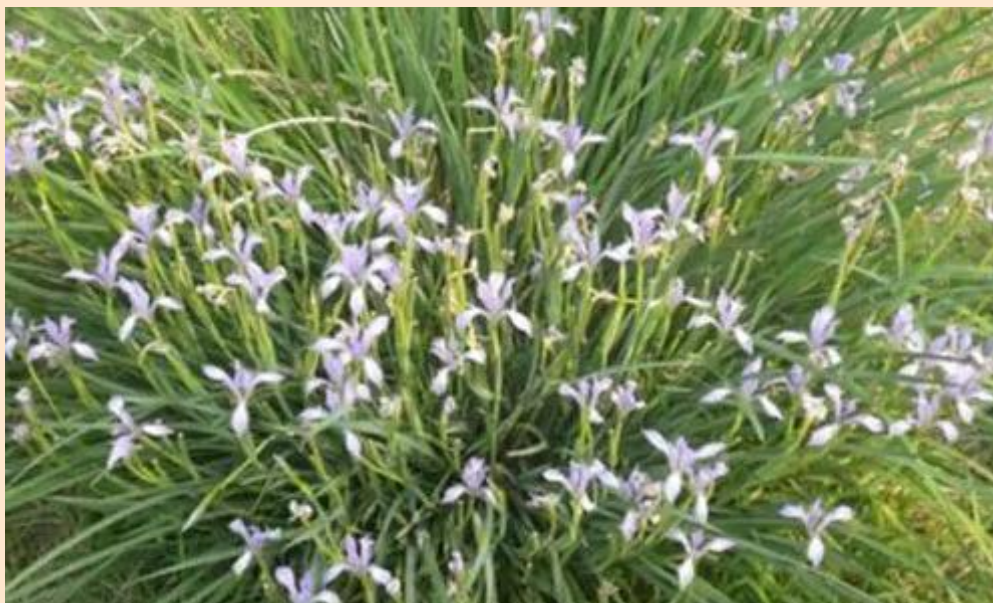
花期 5-6 月。推荐观赏地点：铭德道等。