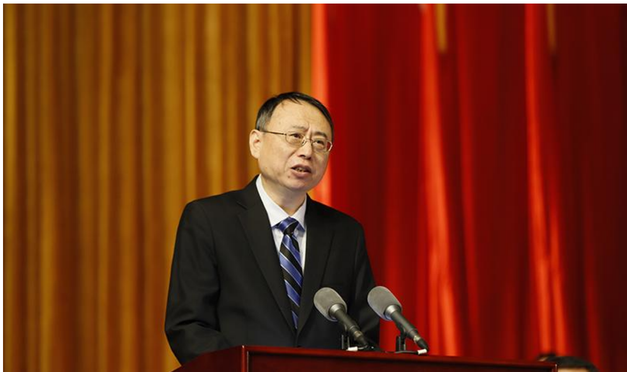
教育部高校学生司司长王辉出席开幕会并讲话

上午 9 时，会议开始。钟登华向全体与会代表汇报出席代表人数，并宣布大会开幕。随后全场起立高唱《中华人民共和国国歌》，会场氛围庄重严肃。