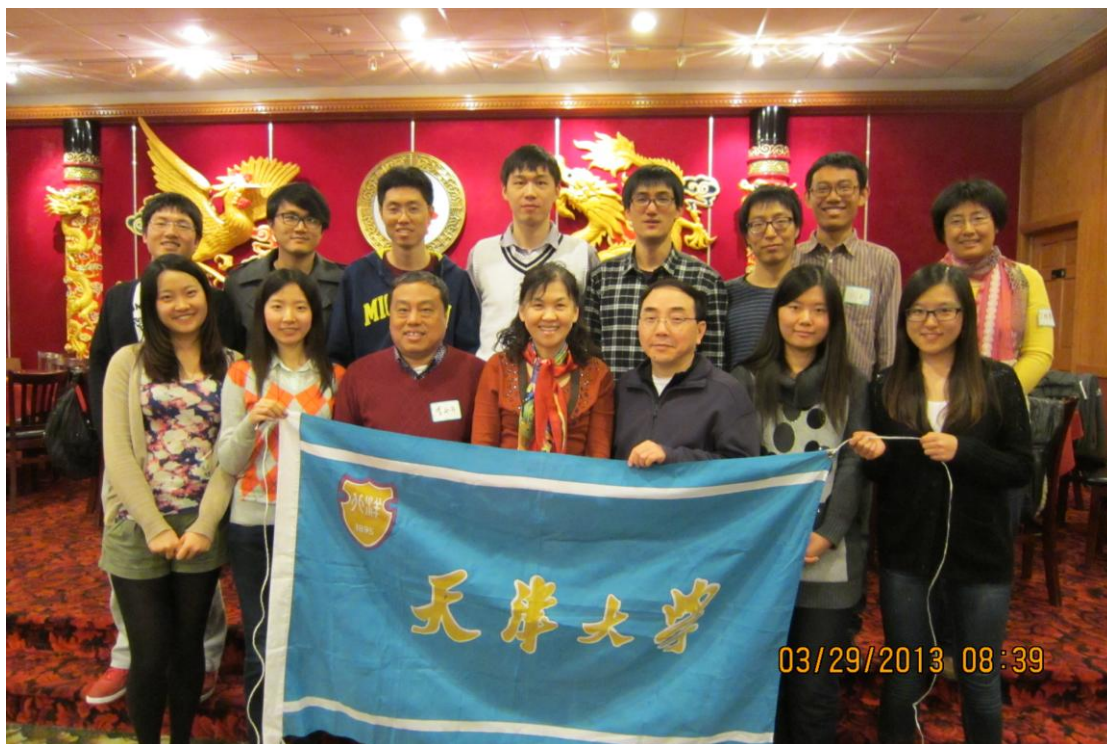
2013年3月密歇根大学部分校友聚会