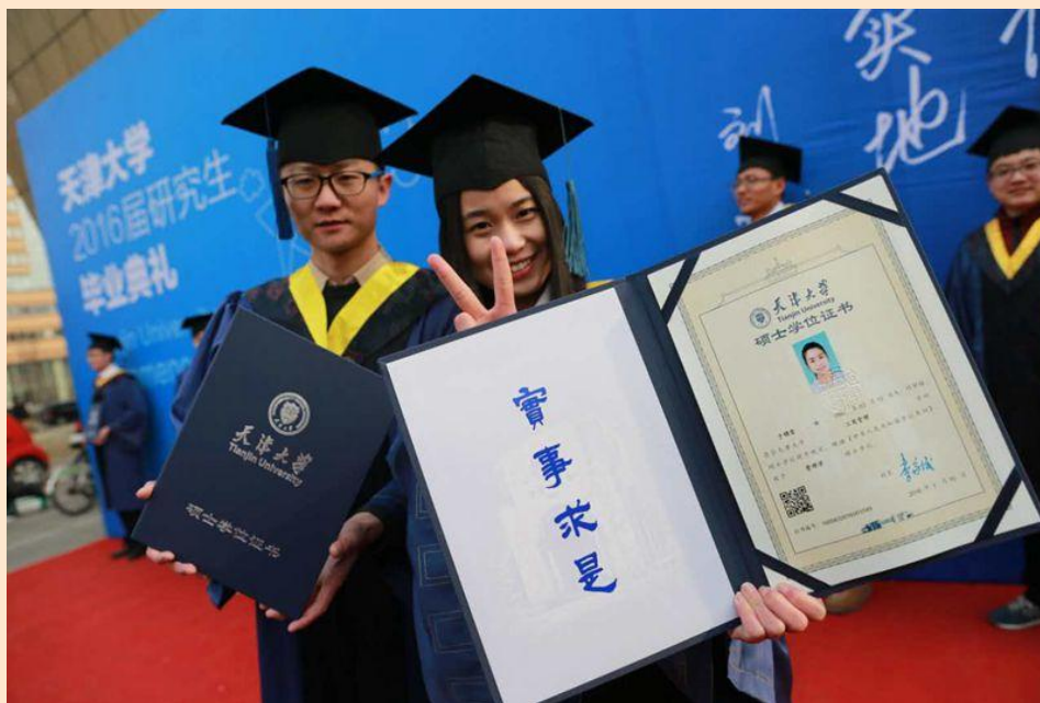
毕业生晒新版学位证书

典礼后，毕业生们纷纷带着“母校专属”的新版学位证书在校园里留下最后的影像。这 3117 名毕业生首次被授予了由天大师生自主设计的新版学位证书。该证书传承了天津大学（前身北洋大学）作为中国第一所现代大学，于 1900 年颁发的“中国第一张大学文凭”中的历史元素，并融合了学校特有的形象标识。